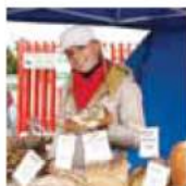
Kells Market Day