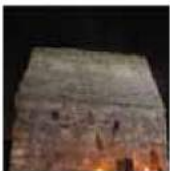
St. Columcille's House