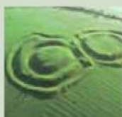
Hill of Tara