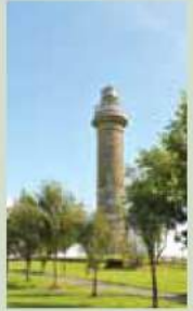
Spire of Lloyd

Ursprünglich befand sich der Turm auf dem Gebiet einer Festungsanlage aus der Eisenzeit. Der Volksgarten ("The People's Park") beherbergt den Armenfriedhof, auf dem viele Opfer der großen Hungersnot (famine) Mitte des 19. Jahrhunderts begraben sind.