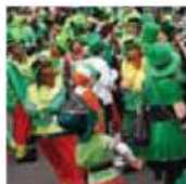
Leprechaun Chéili at St. Patrick's Day