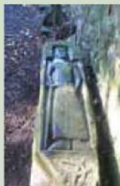
The Abbess at St. John's Cemetery

Hier können Sie sich das Priorat der Johanniter in Kells ansehen (die 1113 gegründet wurden um Pilger auf ihrem Weg nach Jerusalem zu schützen). Das Priorat wurde 1199 von Walter De Lacy, Sohn von Hugh De Lacy (der früher Norman, Lord of Meath hieß) gegründet. Von besonderem Interesse auf diesem Friedhof ist eine mittelalterliche Grabplatte, auf der eine Dame mit einem leinenen Kopftuch abgebildet ist, die ein Tau in der Hand hält. Es wird vermutet, dass es sich um eine Äbtissin handelt. Die Grabplatte trägt daher den Namen "the Abbess" (die Äbtissin).