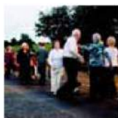
Dancing at the Crossroads