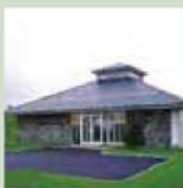
St. Kilian's Heritage Centre