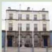
Kells Town Hall

Ursprünglich war die Stadthalle 1853 als Bankhaus von William Caldebeck erbaut worden. Seit 1974 fungiert das Gebäude als Stadthalle. Hier können Sie sowohl ein Faksimile des Book of Kells als auch The Kells' Crosier (9.-11. Jahrhundert) einsehen.