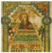
Temptation of Christ