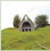
St. Ciaran's Holy Well

Bitte beachten Sie: Alle angegebenen Zeiten sind vom Stadtzentrum von Kells aus gemessen. Bitte lesen Sie die Hinweise aufmerksam, bevor Sie aufbrechen.