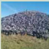
Passage Grave, Loughcrew

(und seine Sammlung an Standsteinen, Cashel, Motte, und Kochstellen, Oldcastle, Co. Meath (36 mins. towards Oldcastle (R163); 20.92 km; nehmen Sie sich für die Besichtigung etwa eine Stunde Zeit) GPS +53 °44'38.40" N -7 °7'7.32" W